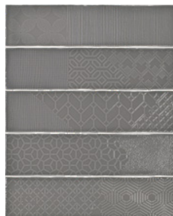
Relieve decor grey