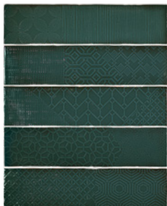
Relieve decor green