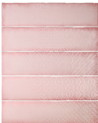
Relieve decor pink