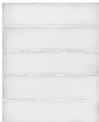
Relieve decor white