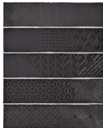
Relieve decor black